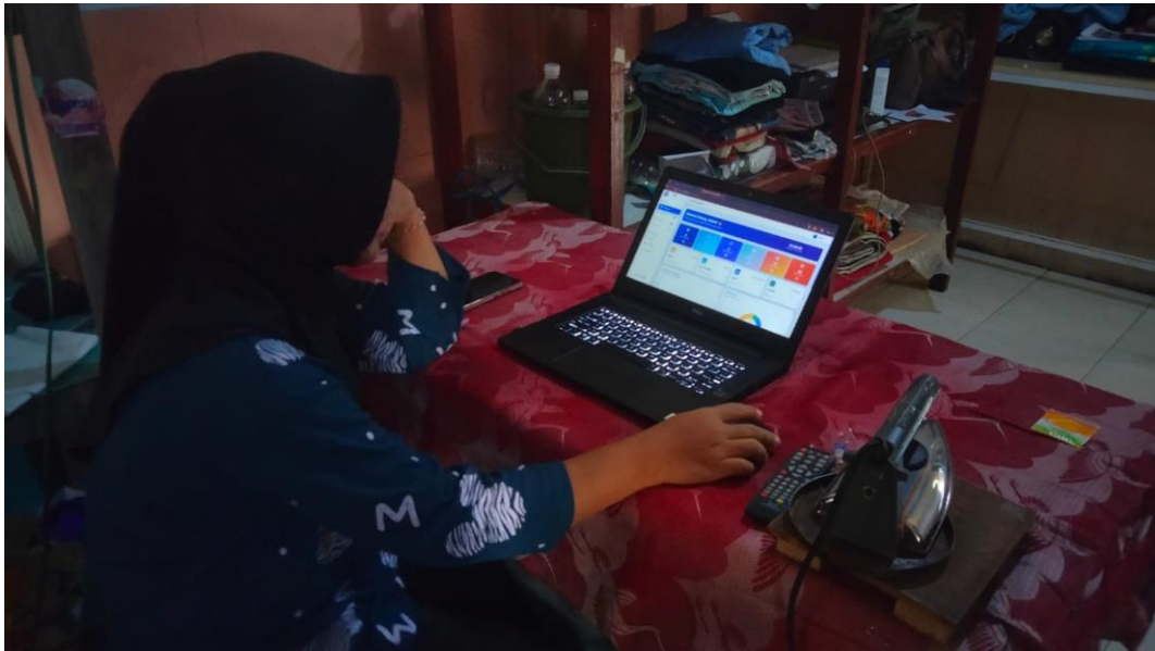
Lampiran 5. Gambar pengarahan ke karyawan..