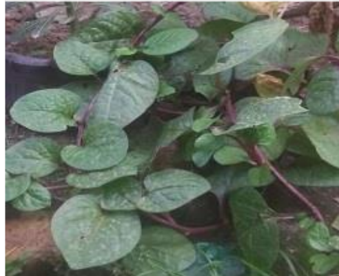
Gambar 2.1 Daun Binahong

Spesies : Anredera cordifolia (Ten.) Steenis