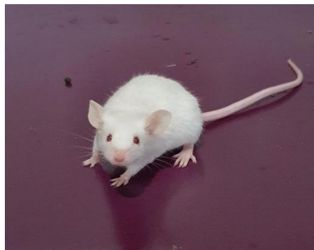
Gambar 2.2 Mencit putih jantan ( Mus musculus . L)

Kingdom : Animalia Filum : Chordata Subfilum : Vertebrata Kelas : Mamalia Ordo : Rodentia Famili : Muridae Genus : Mus Spesies : Mus musculus L.